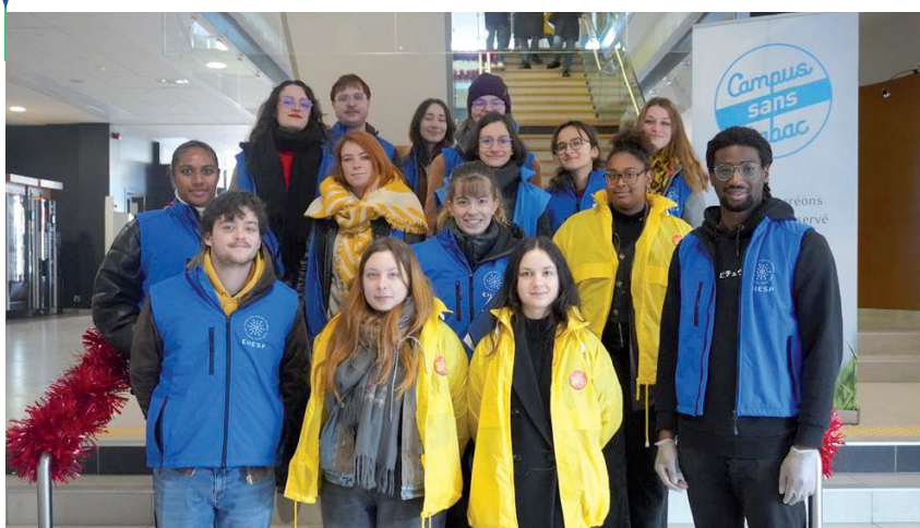
Les ambassadeurs et étudiants impliqués dans le campus sans tabac de l'Ecole des Hautes Etudes en Santé Publique (décembre 2023)

Le nombre d'ambassadeurs et l'amplitude horaire sont à adapter selon la taille et la disposition du campus. À titre d'exemple, pour le campus de l'EHESP (8,8 hectares, 1300 étudiants et 450 salariés), environ 6 étudiants sont recrutés tous les ans pour environ 20 heures (4800 €).