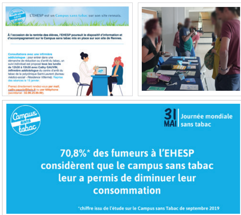
Exemples de messages diffusés / d'animations organisées à l'EHEP autour du thème de l'arrêt du tabac