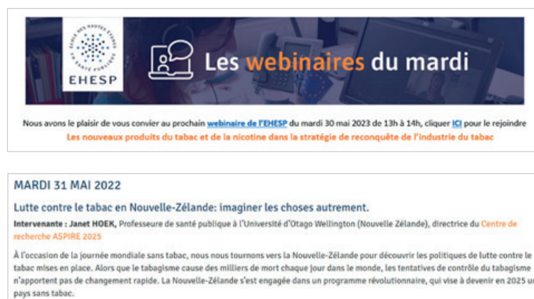
Webinaires sur le tabac organisés à l'EHESP dans le cadre de la journée mondiale sans tabac