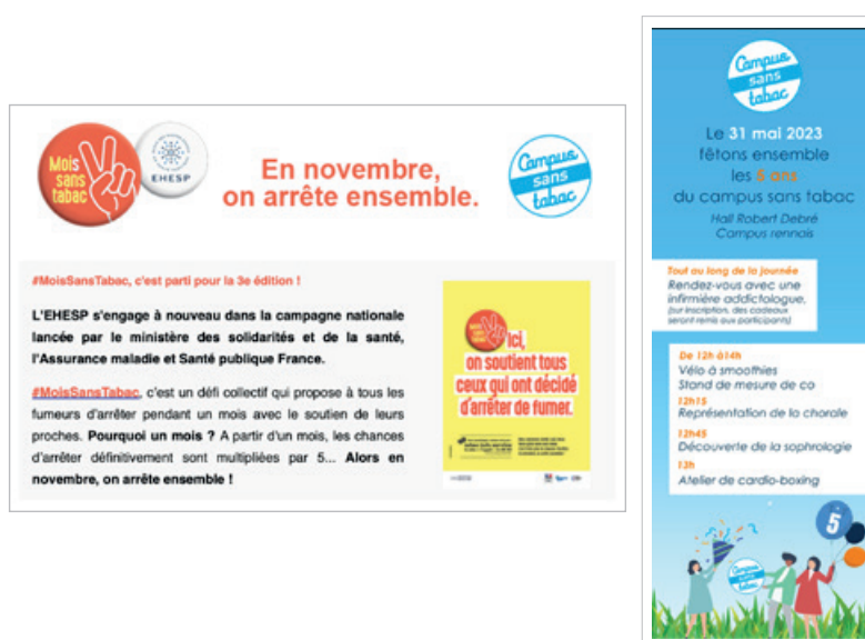
Animations organisées à l'EHESP pour le Mois sans tabac et la journée mondiale sans tabac

Les actions et animations associées au campus sans tabac peuvent être organisées à l'occasion d'événements nationaux (Mois sans tabac en novembre, semaine nationale de lutte contre le cancer en mars), internationaux (journée mondiale de l'OMS sur la lutte contre le Tabagisme le 31 mai), locaux (anniversaires de l'instauration du campus sans tabac, rentrées des étudiants, cérémonies de remise de diplômes, portes ouvertes de l'établissement, journées du personnel, etc.), ou à d'autres moments opportuns pour le lieu d'enseignement supérieur et ses usagers.