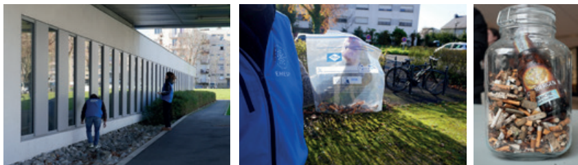
Collecte de mégots par des étudiants bénévoles sur le campus de l'EHESP en 2024