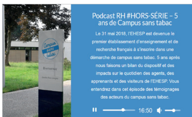
Podcast interne à l'EHESP pour fêter les 5 ans du campus sans tabac